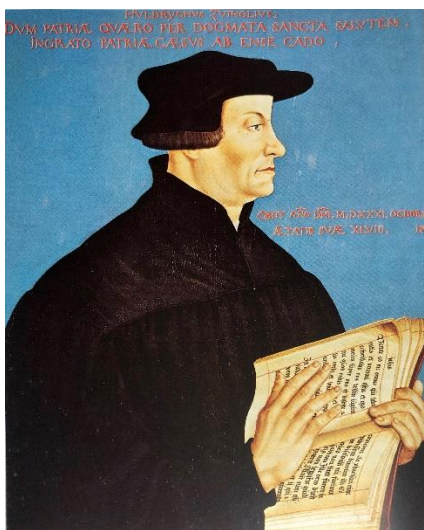
Der Zürcher Reformator Zwingli mit Bibel

Vor rund 500 Jahren bekam die Kirche eine neue Form. Man wollte damals Missstände korrigieren und wieder zurück zu den Ursprüngen der Kirche finden. 'Zurück zu den Quellen' war das Motto der Reformatoren. Damit meinten sie: zurück zu Jesus, zurück zur Bibel und zurück zum Kirchenverständnis der ersten Christen. Doch diese Rückbesinnung stiess nicht überall auf Zustimmung, weshalb es zu einer Spaltung der Kirche kam. Es folgten kriegerische Auseinandersetzungen um den 'richtigen' Glauben.